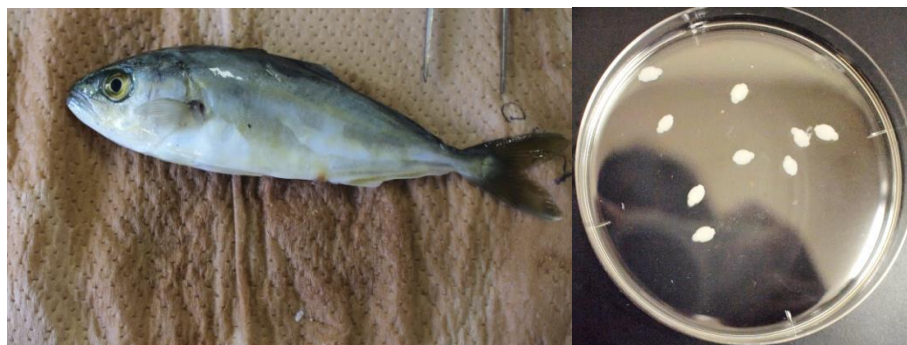
Hình 4. Cá Amberjack ( Seriola dumerili ) được gây nhiễm và Neobenedenia girellae được tách ra khỏi cơ thể cá sau khi điều trị bằng Praziquantel

Thử nghiệm các phác đồ điều trị bằng praziquantel nhằm mang lại hiệu quả điều trị cho loài ký sinh trùng N. girellae .