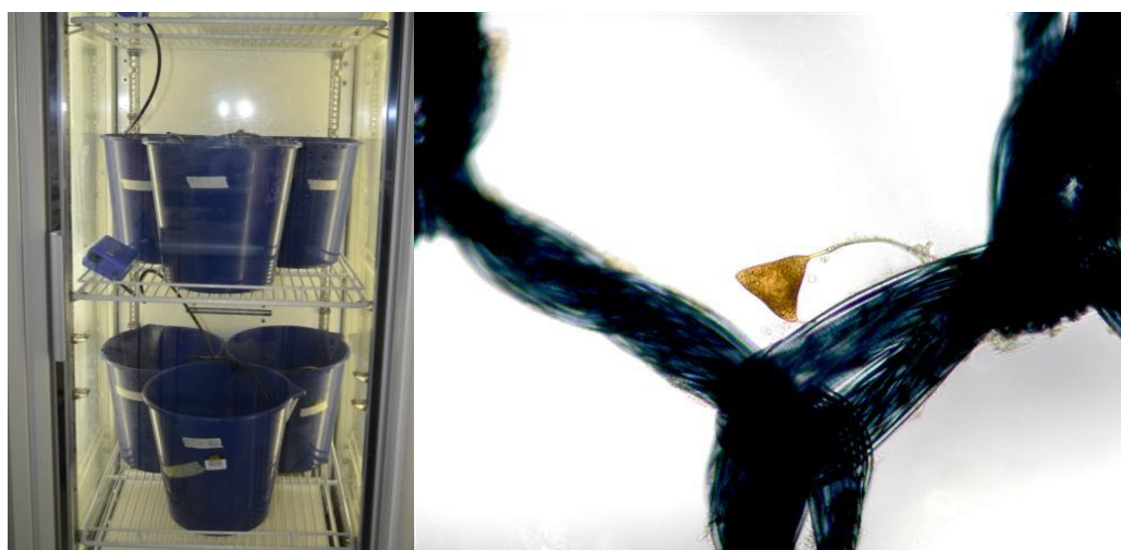
Hình 1. Bố trí thí nghiệm và quan sát trứng của ký sinh trùng bám trên giá thể