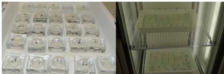
Hình 2. Thí nghiệm ấp trứng hai loài sán Neobenedenia girellae và Benedenia seriolae